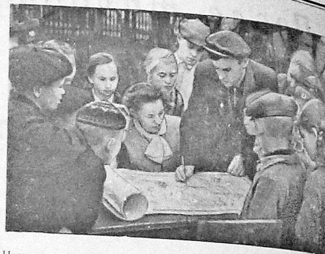
Наступила пора летних каникул в начальных классах городских школ. Ребята готовятся интересно и содержательно провести летний отдых.

ЛОНДОН, 1 июня. (ТАСС). Как передает корреспондент агентства Рейтер из Сингапура, левая Партия народного действия приняла решение провести в Сингапуре, начиная с 6 июня, «неделю протеста» против отказа английского правительства предоставить независимость этой колонии.